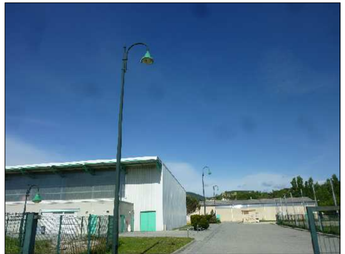
relevé des matériels existants