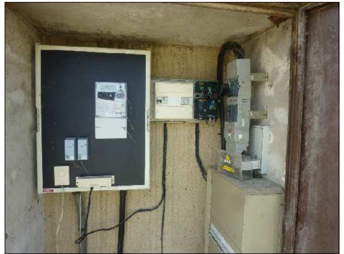
relevé des matériels existants